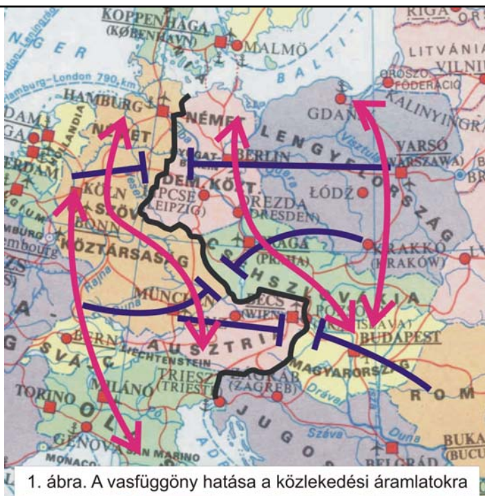
1. ábra. A vasfüggöny hatása a közlekedési áramlatokra