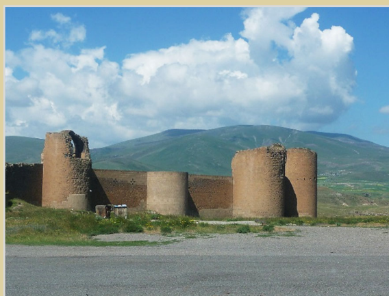
Ani – 1001 örmény templom városa volt