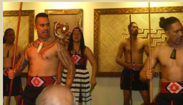
Maori harci bemutató