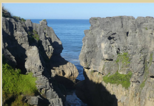
A Palacsinta sziklák