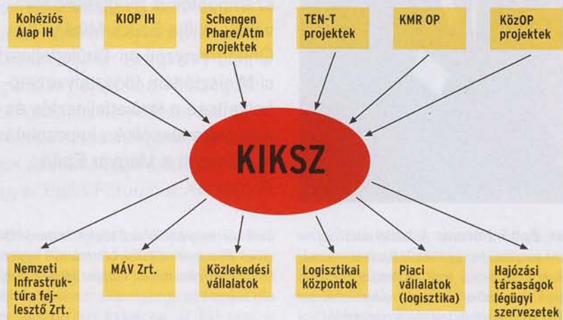
A Közreműködő Szervezettel kapcsolatban lévő szervezetek

A 2007-2013 időszakban az eddig megvalósított programoknál, és projekt volumenténél egy nagyságrenddel nagyobb fejlesztési forrásokról kell rendelkezni, és jóval nagyobb számú projektről kell gondoskodni, ami igen nagy terhet ró mind a Kedvezményezettek, mind a program szakmai megvalósulását felügyelő Közreműködő Szervezetre és Irányító Hatóságra.