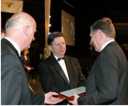
Közút – 2005. március